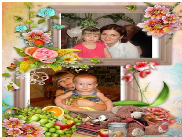
(Фото Корнаушенко О.В.с детьми )

В каждом детском саду, в канун этого праздника весны проводятся торжественные мероприятия. И в нашем детском саду прошел утренник для детей, посвящённый Международному женскому дню.